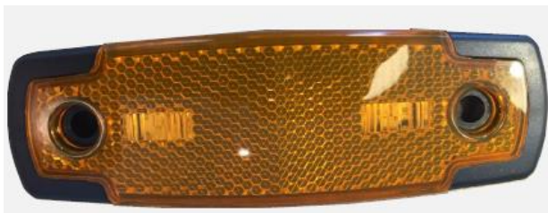
Radarmodule in zijmarkeringslamp

De sensoren zijn onder andere verwerkt in speciaal ontwikkelde zij-markeringslampen. Op de truck kan de radar achter de (zij)bumpers worden geplaatst. Dit maakt de installatie nagenoeg onzichtbaar.